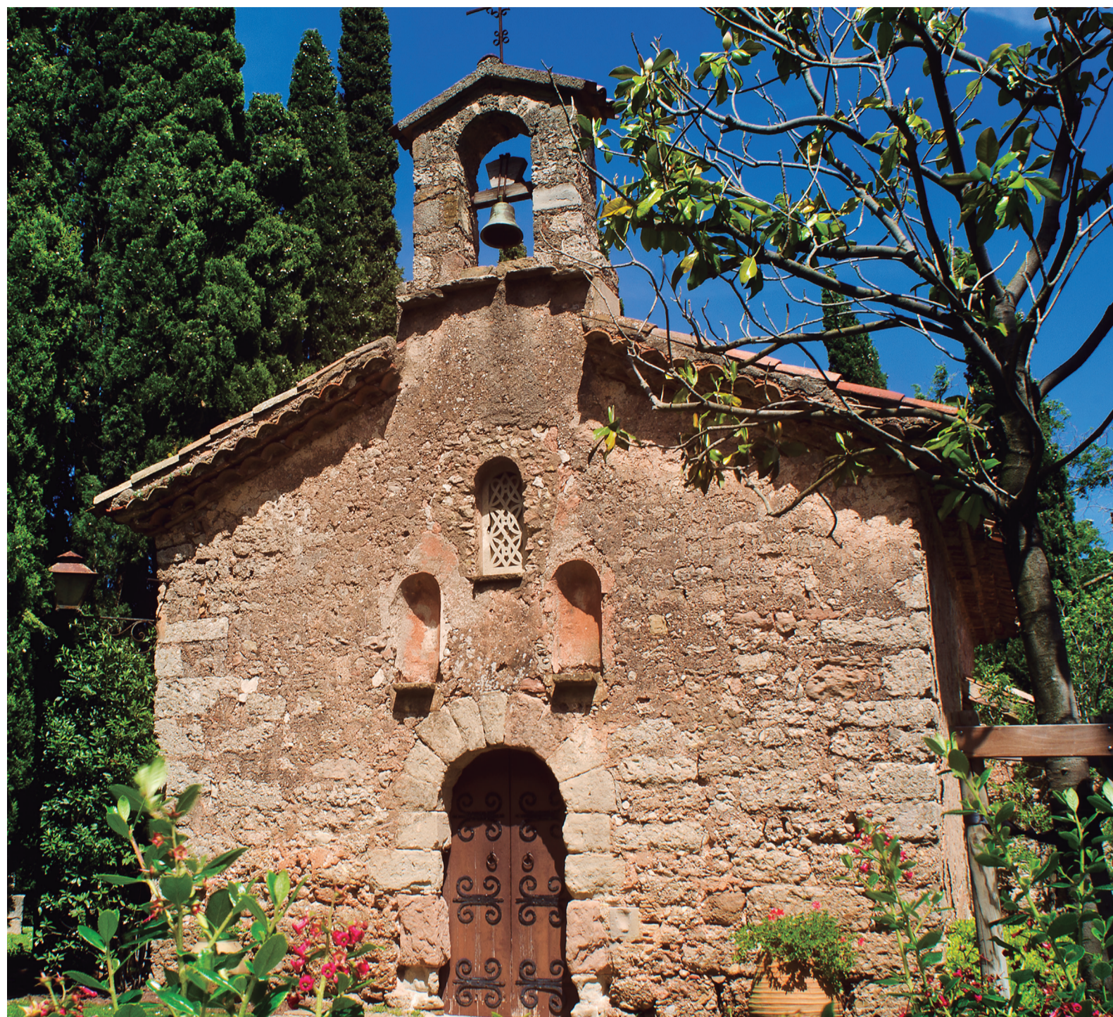
Ermita de Sant Iscle.

Les ermites de la muntanya van continuar acollint ermitans, ara integrats dins la comunitat monàstica de Montserrat, des del segle XVI fins a la Guerra del Francès (1808-1814), quan moltes foren destruïdes i alguns ermitans, assassinats, fet que posà fi a la presència eremítica contínua a Montserrat. Des d'aleshores, només de forma puntual, alguns monjos de Montserrat han fet estades temporals més o menys llargues en algunes de les ermites. L'ermita de Sant Iscle, situada dins del jardí del monestir, permet fer-nos una idea de com eren aquestes primeres ermites. Aquesta petita església, d'una sola nau i amb un absis semi-circular, ha arribat fins als nostres dies amb algunes modificacions. Durant la Guerra del Francès fou utilitzada com a polvorí i quedà en molt mal estat.