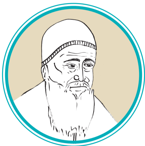
Giuliano Della Rovere (1443-1513)

D'aquest claustre només se'n conserven dues ales al costat esquerre de la façana del monestir. El va fer construir, el 1476, l'abat comendatari Giuliano Della Rovere, que més tard va ser papa amb el nom de Juli II. Columnes elegants, capitells delicadament esculpits amb caps humans, animals fantàstics i decoració vegetal. Un dels capitells reproduïx l'escut del cardenal Della Rovere. Tot pedra picada, transportada de lluny. Una obra que va ser molt costosa.