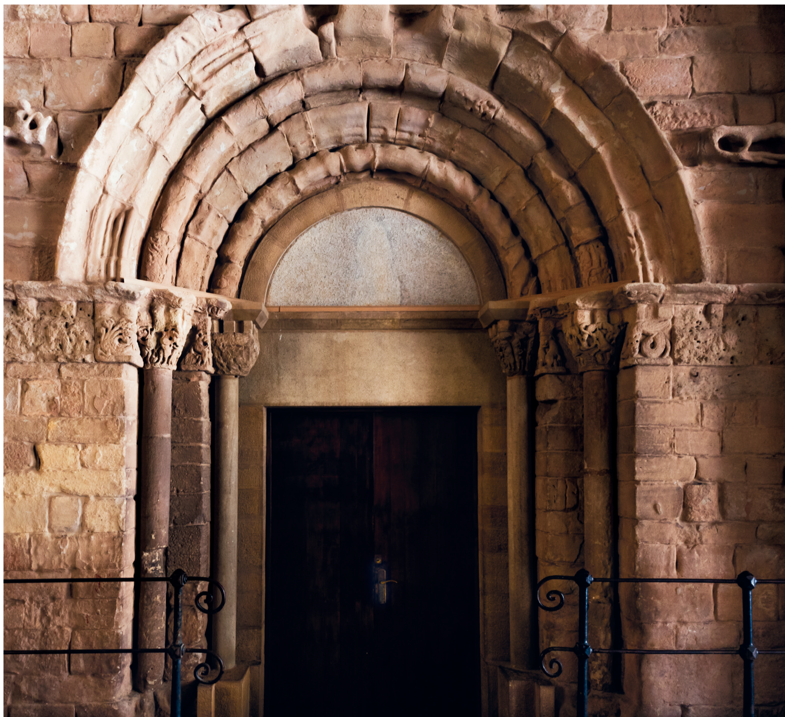
Portalada de l'església romànica.