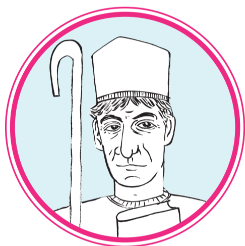
Abat Oliba (971-1046)

Arquitectònicament, no sabem res d'aquesta església. De petites dimensions, es trobava situada al davant de l'actual basílica, on hi ha una fita que recorda la ubicació de l'altar. Al passadís de l'atri trobem la portalada d'aquesta segona església, traslladada de la seva ubicació original.