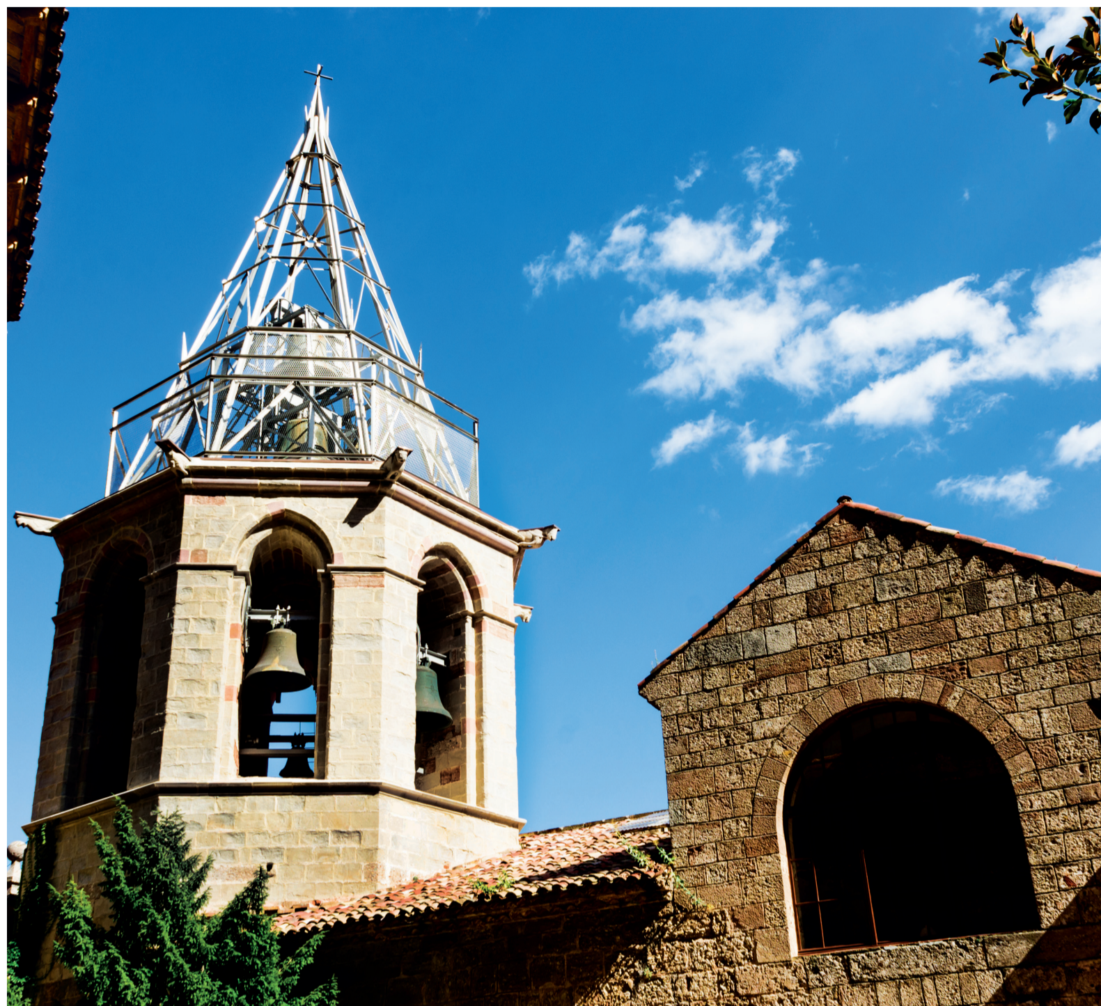
Campanar de la basilica.

Tot i que el campanar fa uns quaranta metres d'alçada, queda una mica ofegat pels edificis que l'envolten. Això no impedeix, però, que totes les campanes puguin sentir-se no sols a Montserrat, sinó també a bastants quilòmetres enllà.