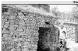
Una passejada per gaudir de la natura i la cultura de les tines

▶ Les construccions de pedra seca tenen un valor impagable per als amants de l'excursionisme. No només són referents en el camí sinó que doten la passejada d'un atractiu cultural afegit. El Consorci de les Valls del Montcau està contribuint a dignificar aquest patrimoni amb un treball de restauració que afavoreix la visita. Alçades al mig de la natura, tines i barraques són una llaminadura per als qui estimen l'excursionisme i el coneixement del medi.